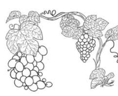
d. patru silabe.