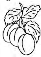
b. o silabă;