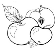
c. trei silabe;