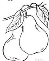
a. două silabe;